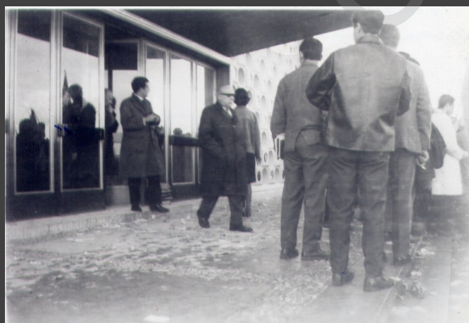
□ + + + + + 1887-CX7-EN1.jpg