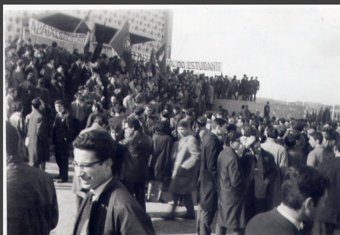
□ + + + + + 1888-CX7-EN1.jpg