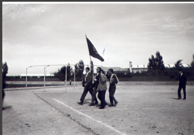
□ + + + + + 1886-CX7-EN1.jpg