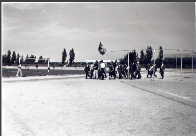
□ + + + + + 1885-CX7-EN1.jpg