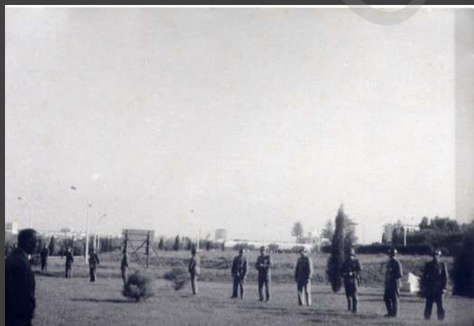
□ + + + + + 1897-CX7-EN2.jpg