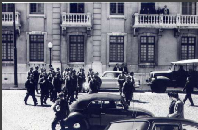
□ + + + + + 1915-CX7-EN2.jpg