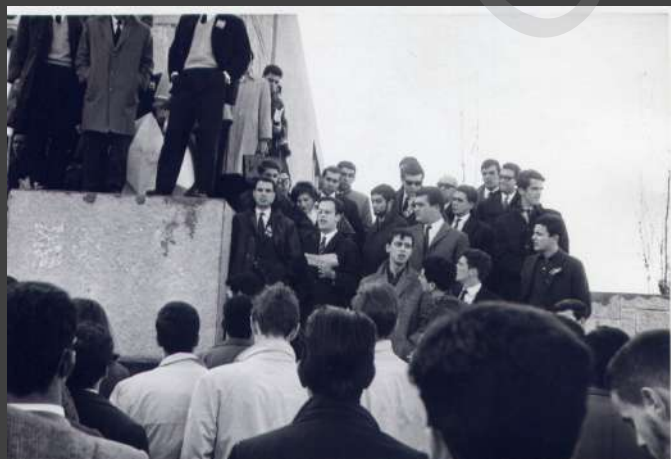
□ + + + + + 1912-CX7-EN2.jpg