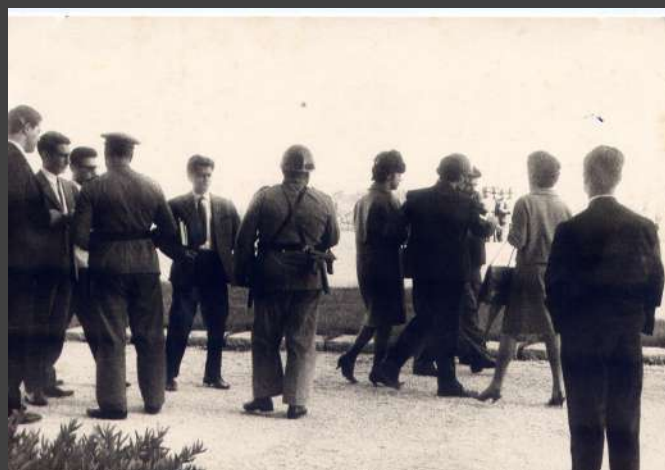
□ + + + + + 1898-CX7-EN2.jpg