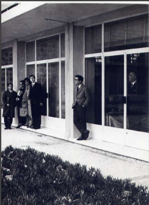
□ + + + + + 1910-CX7-EN2.jpg