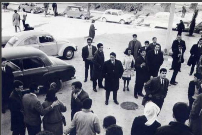
+ + + + + 1907-CX7-EN2.jpg