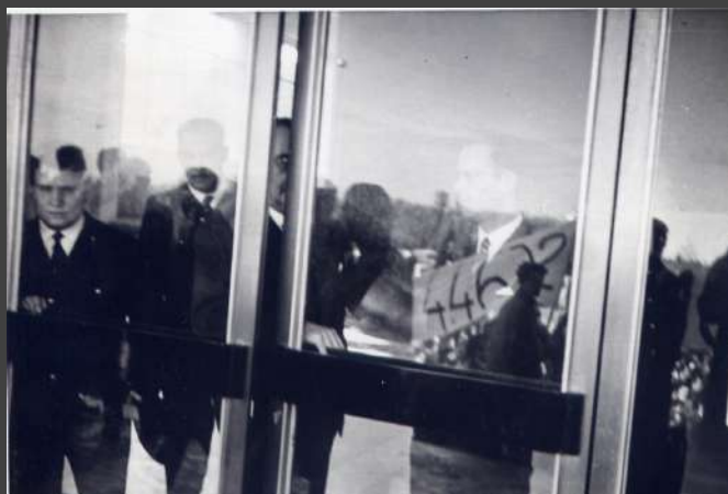
□ + + + + + 1913-CX7-EN2.jpg