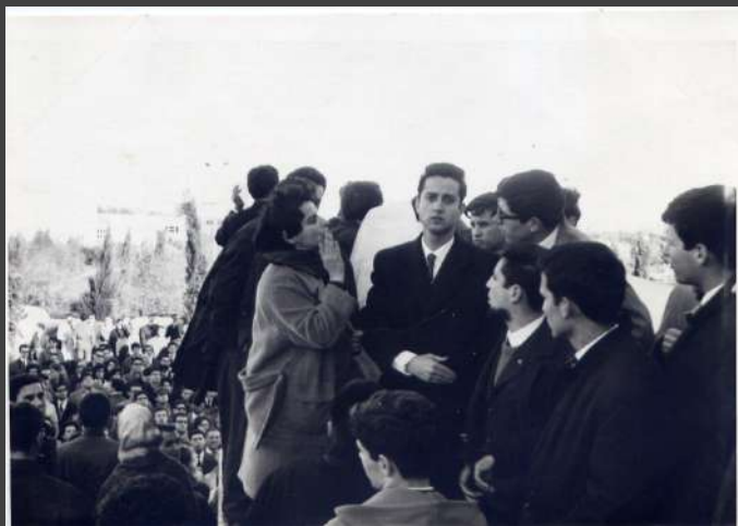
□ + + + + + 1914-CX7-EN2.jpg