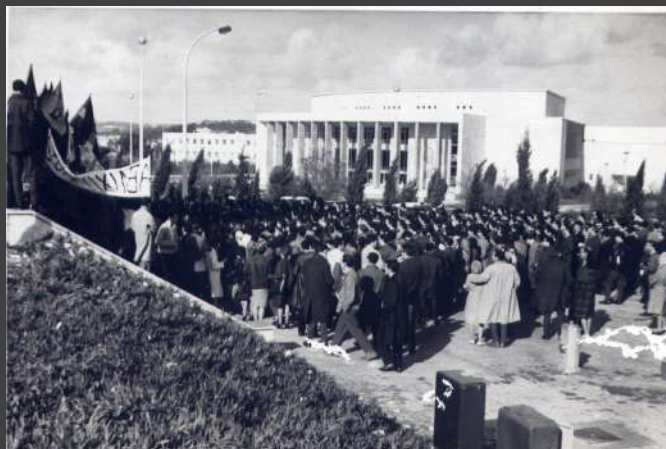
□ + + + + + 1911-CX7-EN2.jpg