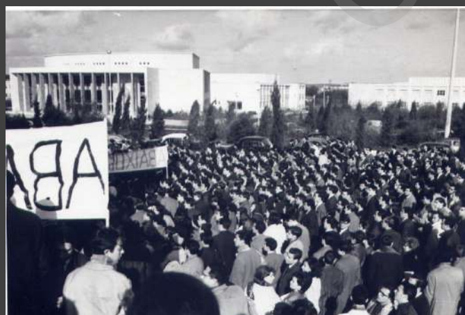
+ + + + + 1909-CX7-EN2.jpg